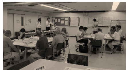
◆まちづくりの会の様子