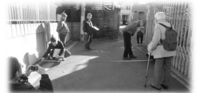
◆実際にまちを歩いて点検マップを作成