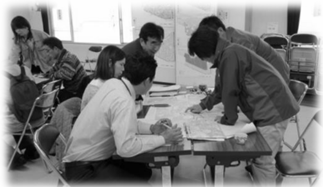
●発見した課題から点検マップを作成