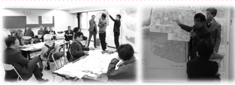
●グループ別に作成した点検マップを発表