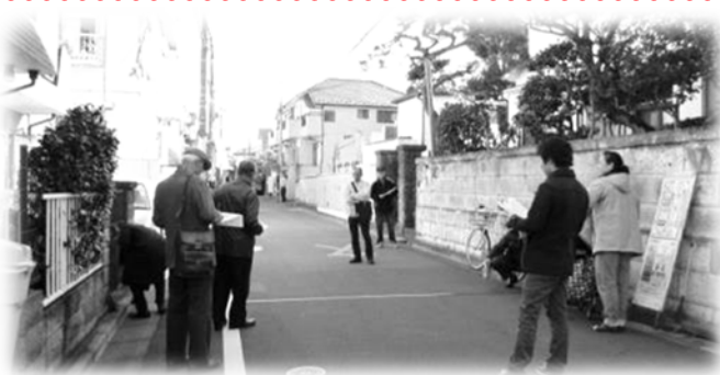
●まちを歩いて課題を発見

第2回「大和町まちづくりの会」で行ったまち歩き及び意見交換を踏まえ、大和町まちの点検マップとして整理しました。