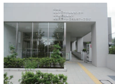
▲南部すこやか福祉センター