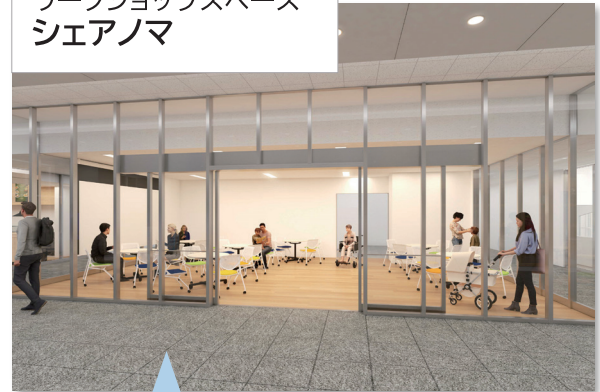
ワークショップスペース シェアノマ