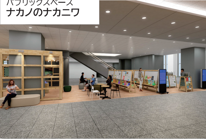
パブリックスペース ナカノのナカニワ