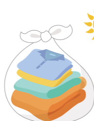
◀古着・古布は 必ず晴れた日に 出してください

区内全域で、町会・自治会など が集団回収を行っています(古着・ 古布は一部地域を除く)。集団回 収集積場所に出してください。 ☆古着・古布はリサイクル展示室 でも回収(火・木曜日を除く午前 10時30分~午後3時30分)。詳 しくは、区HPをご覧ください