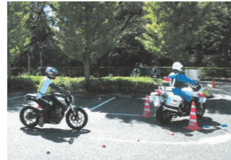
▲白バイ隊員による指導

申込み 9月7日からの平日午前8時30分～午後5時に電話で、野方警察署交通総務係へ。先着15人。当日は損害保険(200円)に加入