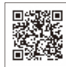
▲ 50コイン(120円)で購入できます ダウンロードは上記二次元コードから