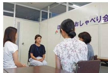
▲不妊治療経験のあるピアカウンセラーを交えたおしゃべり会

申込み 8月6日~9月11日に電子申請か、電話または直接、出産・育児支援係へ ☆両方への参加も可