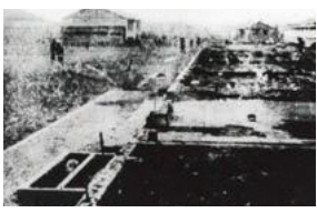
▲空襲で焼けた桃園小学校