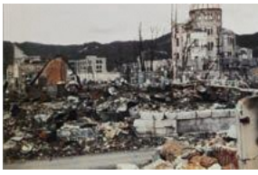
▲爆心地とドーム(広島)