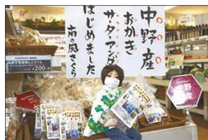
▲ 新しい衣装で SNS に登場しました

新しいナカノさんの衣装デザイン(柄や形などの設計)を募集し、入選した10点をナカノさんの寸法で製作。全国から123点ものデザインの応募があり、多くの方がナカノさんや中野に興味を持ってくださったことをうれしく思います。製作には学生が積極的に参加。新しい服を着たナカノさんの登場も楽しみにしています。