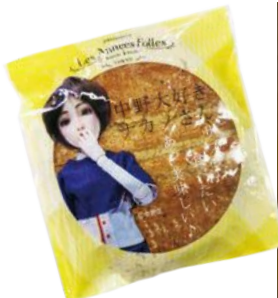
▲ 1枚160円(税抜き)。サクサクとした食感が特徴