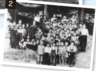
1 戦災で荒れ果てた新井町 2 疎開中の鷺宮小学校の児童