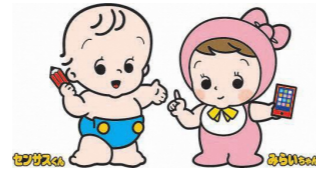
▲国勢調査イメージキャラクター「センサスくん」と「みらいちゃん」

パソコンやスマートフォンを利用したオンライン回答、調査票での回答(郵送可)ができます。