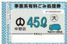
中野区事業系有料ごみ処理券▶

事業系ごみを区のごみ収集に出す場合は「中野区事業系有料ごみ処理券」が、家庭から粗大ごみを出す場合は「中野区有料粗大ごみ処理券」が、それぞれ必要です(いずれもシール状)。他区の有料ごみ処理券は、中野区内では使用できません。