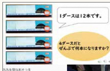
学習教材を活用した家庭学習

オンラインの学習教材・会議機能を活用することで、子どもたちの学習状況やペースに合わせて家庭学習を進められます。また、登校できない子どもたちに対して、一人ひとりの状況に応じた家庭での学習や交流・連絡を支援できます。