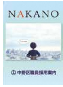
◀区HPでもご覧いただけます

中野区の案内はこちら パンフレット「中野区職員採用案内」は、受験するみなさんを応援する1冊。区の概要の他、職員からのメッセージなどを紹介しています。区役所4階3番窓口で配布中。ぜひご覧ください。