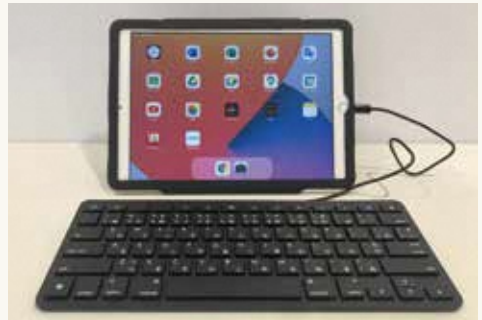
▲各校に配備する機器の例

区は、今年度中に全区立小・中学校に一人1台の端末を配備。学校のネットワーク環境を整備するなど全ての子どもたちの学びを保障する取り組みを進めています。