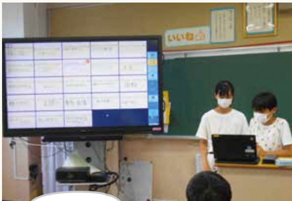
電子黒板を使った授業の様子

電子黒板やタブレット端末などICT(情報通信技術)機器を積極的に活用することで、より良い問題解決を図る協働的な学びなど双方向授業をより効果的に実現します。