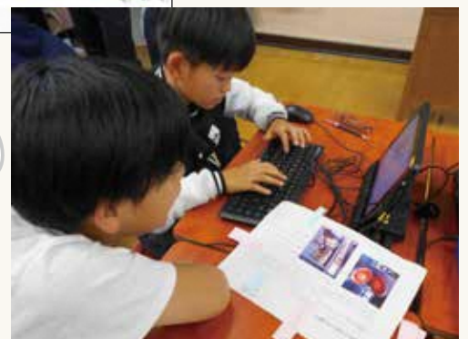
タブレット端末を活用した授業の様子