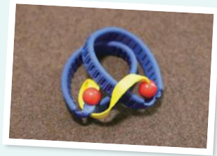
▲伴走者と一緒を持つ「絆」は心もつながる

1982年生。弥生町在住。あん摩マッサージ指圧師として都内企業の福利厚生施設に勤務する傍ら、視覚障害者ランナーとして全国各地の大会で入賞。パラリンピック出場を目指す