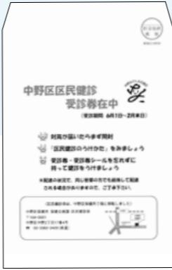
▲実物は茶色の封筒

区民健診が6月1日から始まります。がんや高血圧症、糖尿病、脳血管疾患などは生活習慣に起因して発症することが多い疾病です。症状がなくても健康であるとは限りません。健診を受けて初めて分かることもあるので、この機会に受診しましょう。 ☆下記の説明にある受診券などは、A4サイズの封筒(右の写真)で5月末ごろ郵送。届いた方は中身の確認を