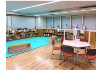
美鳩ライブラリー