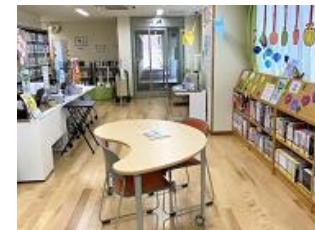
中野第一ライブラリー