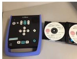
左： プレクストーク