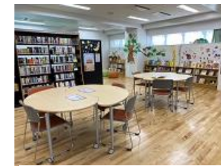
みなみのライブラリー