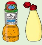
蛋黄酱和沙拉酱的瓶