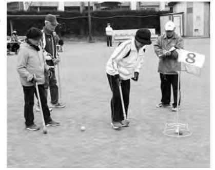
ホールポストを狙う