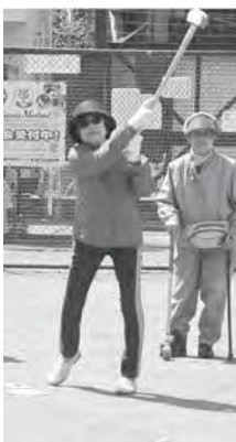
勢いよくスイング