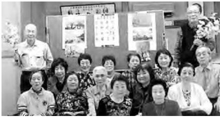
上高田寿クラブのお花見会・誕生会にて

上高田地区の上高友愛クラブ連合会では、総会で友愛クラブの拡大を決め、役員会で会長が先頭を切って行動することを申し合わせ