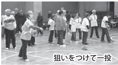
狙いをつけて一投