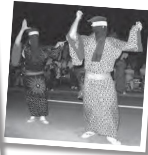
独特の世界観のある 西馬音内踊り