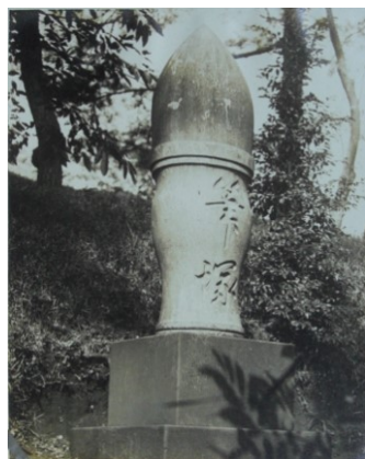
■大正～昭和初期