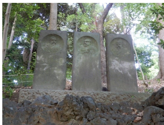
■現在 (2022. 07. 30 撮影)