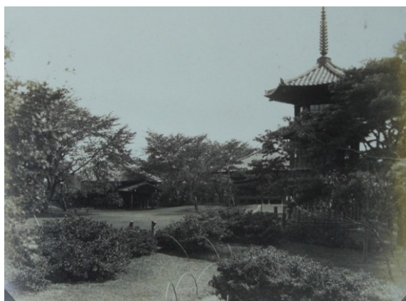
■大正～昭和初期