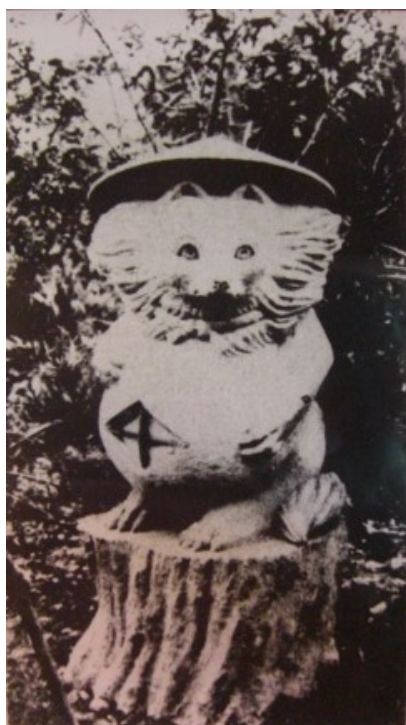
■大正～昭和初期