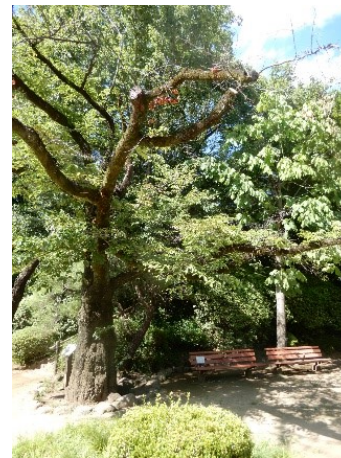
■現在（2022. 07. 30 撮影）