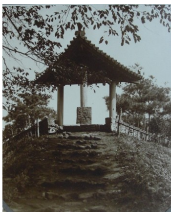
■大正～昭和初期