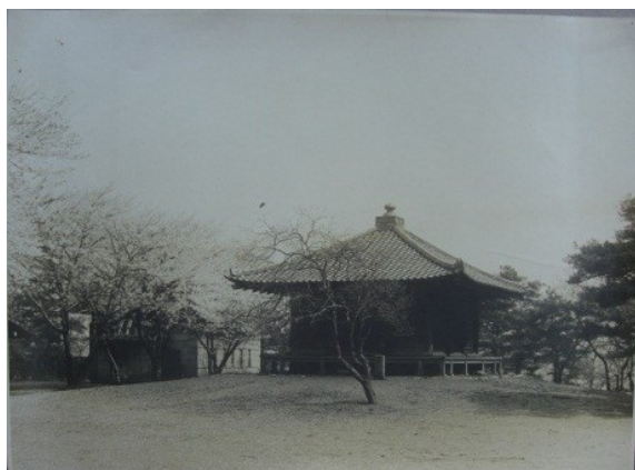
■大正～昭和初期