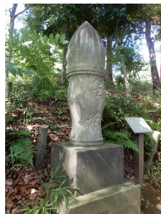
■現在 (2022. 07. 30 撮影)