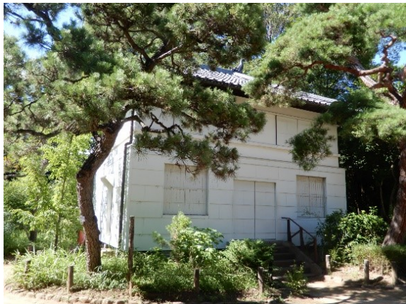
■現在 (2022. 07. 30 撮影)