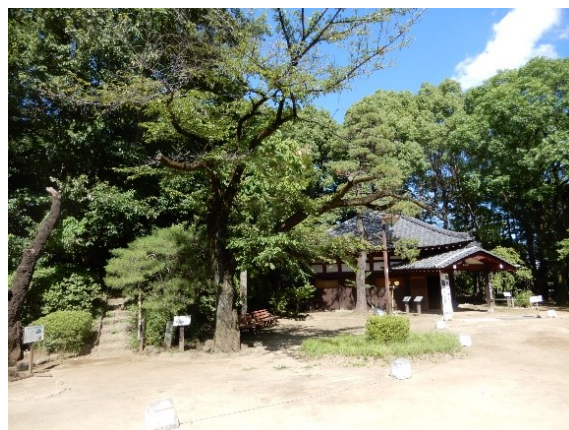
■現在（2022. 07. 30 撮影）