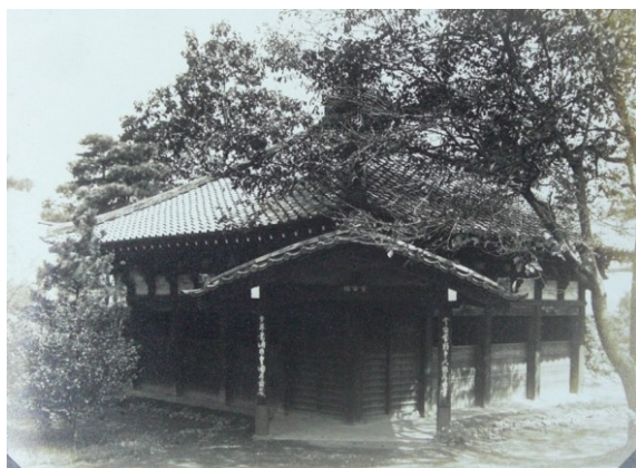
■大正～昭和初期