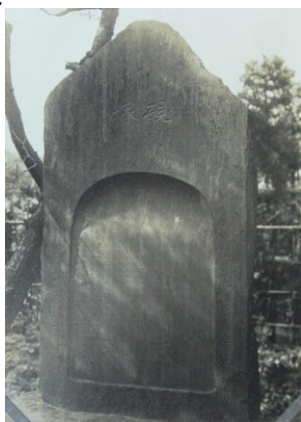
■大正～昭和初期