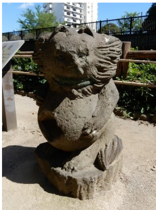
■現在（2022. 07. 30 撮影）