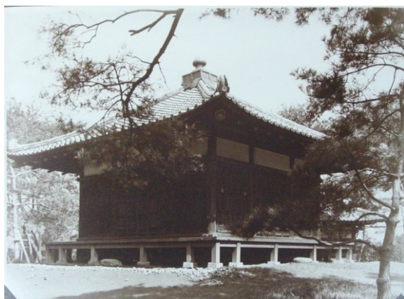
■大正～昭和初期