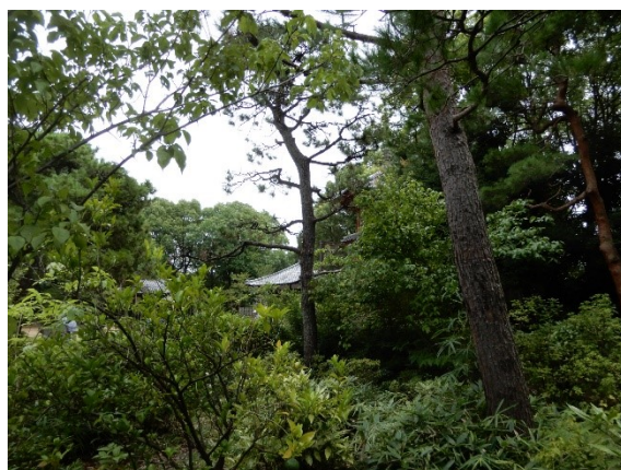
■現在 (2022. 08. 26 撮影)