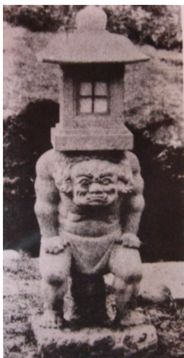
■大正～昭和初期