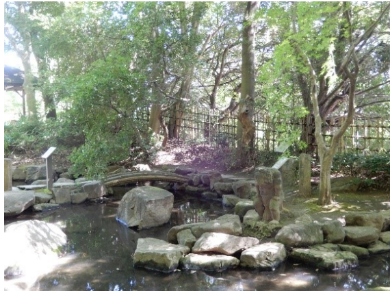
■現在 (2022. 07. 30 撮影)