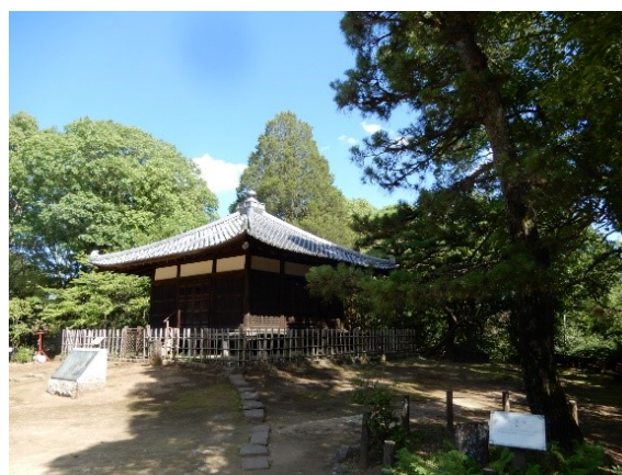
■現在（2022. 07. 30 撮影）