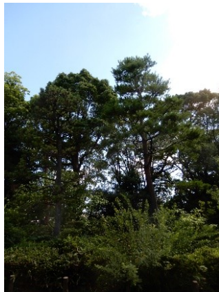
■現在 (2022. 07. 30 撮影)