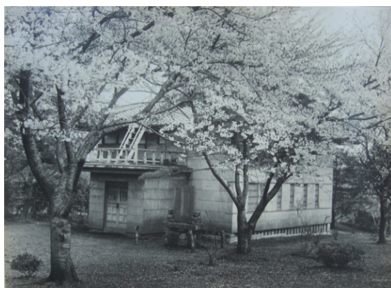
■大正～昭和初期