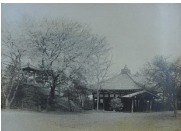
■大正～昭和初期