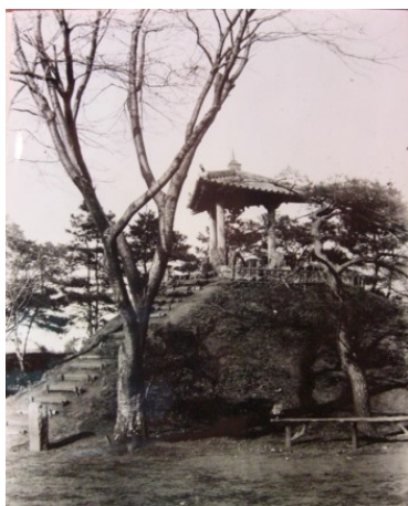
■大正～昭和初期