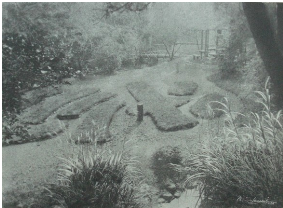
■大正～昭和初期