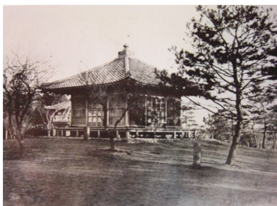
■大正～昭和初期