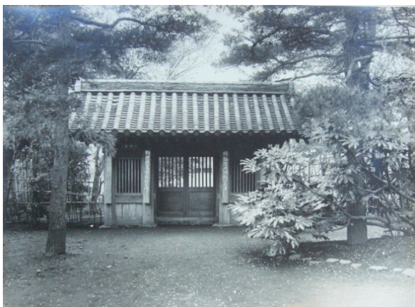
■大正～昭和初期