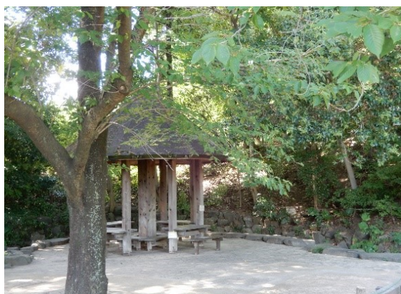
■現在 (2022. 07. 30 撮影)