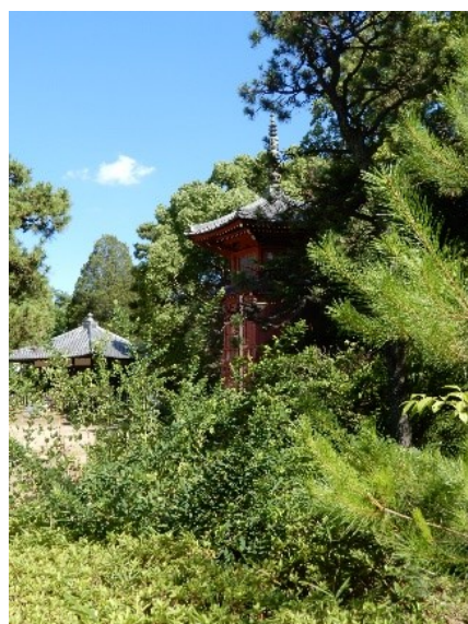
■現在 (2022. 07. 30 撮影)