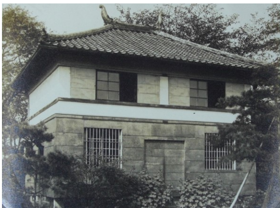
■大正～昭和初期