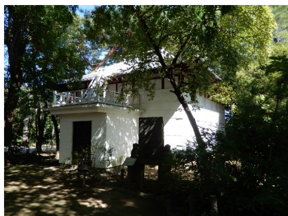
■現在 (2022. 07. 30 撮影)