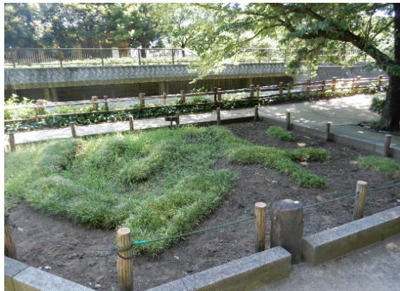
■現在 (2022. 07. 30 撮影)