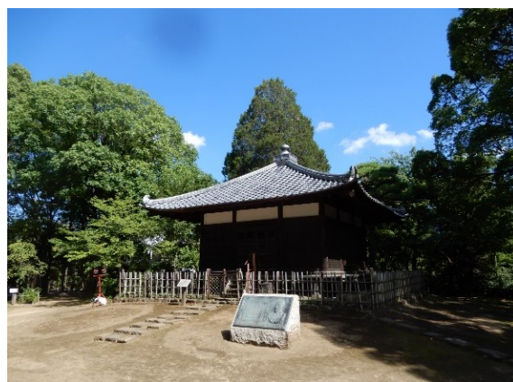
■現在（2022. 07. 30 撮影）