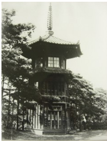
■大正～昭和初期