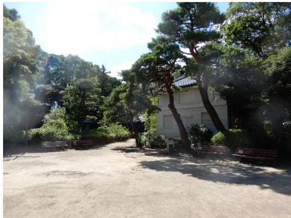
■現在 (2022. 07. 30 撮影)