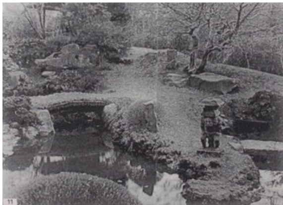
■大正～昭和初期