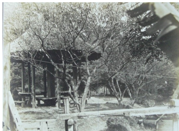
■大正～昭和初期