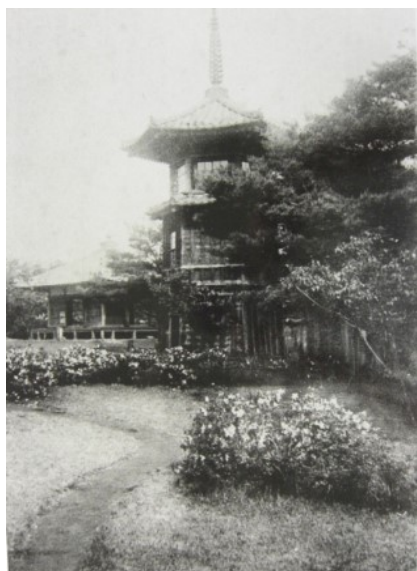
■大正～昭和初期