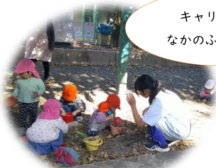
キャリア保育園 なかのふじみちよう

中学生たちは、幼児クラスでは、鬼ごっこや腕相撲でかいっぱい関わり、乳児クラスでは、目線を合わせるよう、かがんで優しいことばかけをしていました。