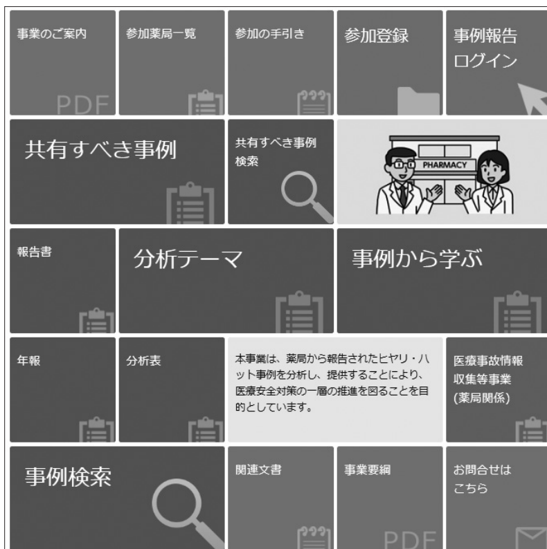
図表IV-1 ホームページのトップ画面

本事業では、事業計画に基づいて、報告書や年報、共有すべき事例、事例から学ぶなどの成果物や、匿名化した報告事例などを公表している。本事業の事業内容の掲載情報については、パンフレット「事業のご案内」に分かりやすくまとめられているので参考にさせていただきたい ( https://www.yakkyoku-hiyari.jcqh.or.jp/pdf/project_guidance.pdf )。