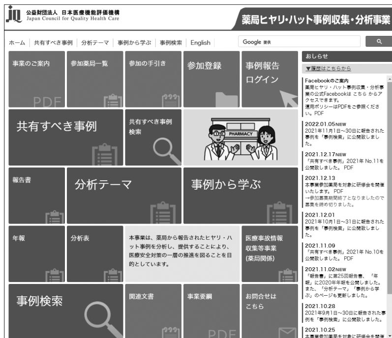
図表IV-1 ホームページのトップ画面

本事業では、事業計画に基づいて、報告書や年報、共有すべき事例、事例から学ぶ等の成果物や、匿名化した報告事例を公表している。本事業の事業内容の掲載情報については、パンフレット「事業のご案内」に分かりやすくまとめられているので参考にさせていただきたい ( http://www.yakkyoku-hiyari.jcqh.or.jp/pdf/project_guidance.pdf )。