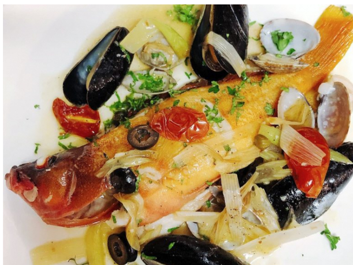
アクアパッツァ (1100円~/税込)

11:30からのランチタイムでは、お得な週替わりのパスタランチ (サラダ・ドリンク付1100円/税込) をはじめ、たくさんの種類のパスタを選べます。人気No.1の「ペスカトーレ・リングイネ」は、海の幸がたっぷり楽しめるトマトソースのパスタで、もちもちの生麺がソースにしっかりと絡んでいます。