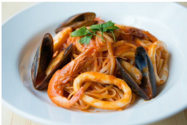
ペスカトーレ・リングイネ (990円/税込)

11:30からのランチタイムでは、お得な週替わりのパスタランチ (サラダ・ドリンク付1100円/税込) をはじめ、たくさんの種類のパスタを選べます。人気No.1の「ペスカトーレ・リングイネ」は、海の幸がたっぷり楽しめるトマトソースのパスタで、もちもちの生麺がソースにしっかりと絡んでいます。