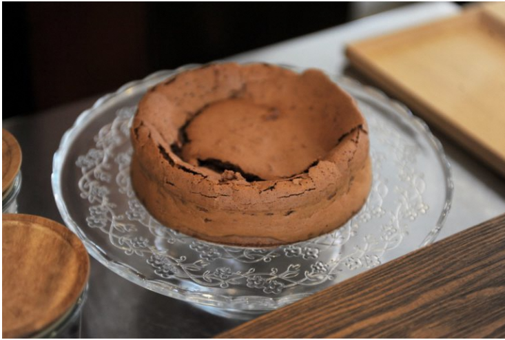
ガトーショコラ (1ピース580円/税込)

また、コーヒーのお供には、奥様が作るガトーショコラやチーズケーキ、焼き菓子などがあり、6月～9月にはコーヒーゼリーもお店に並びます。