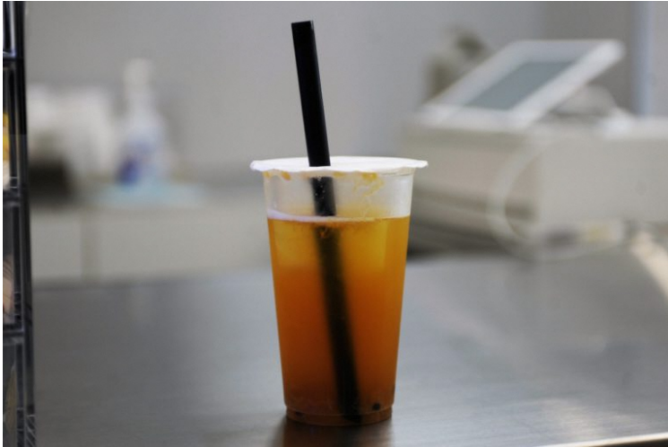
台湾フルーツティー（500円/税込）

「ゴスラテ」は、ミネラルが豊富でデトックス効果もあるチャコール（炭）パウダーが入っているカフェラテ。心地良い苦みが口いっぱいに広がります。