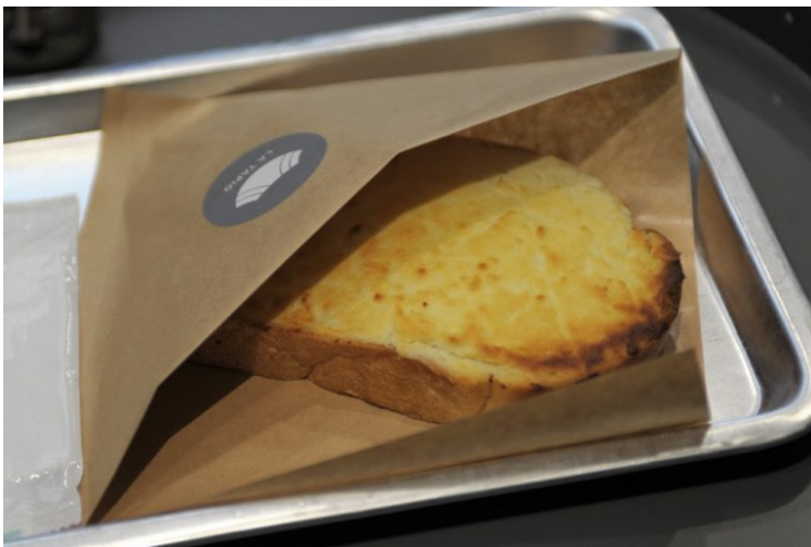
奶酥（ナイスウ）トースト（450円/税込）

「台湾フルーツティー」は、青茶の中に、パイナップル、パッションフルーツ、リンゴなどのフルーツが入っており、甘酸っぱくて爽やかなお茶です。