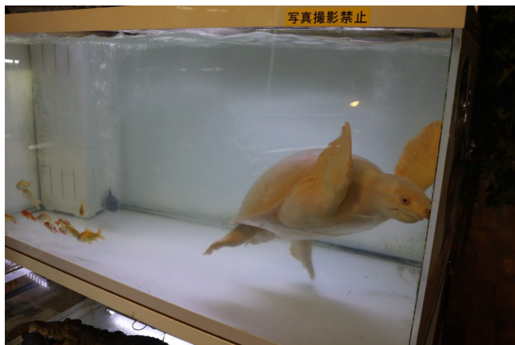
「アルビノ"スッポンモドキ」。価格はお問い合わせにて。

ほかにも、フェネックスやモリフクロウ、リスザルといったエキゾチックアニマルなど、豊富な品揃えが自慢のお店です。小動物のラインナップは仕入れ状況によって異なるのでご注意ください。