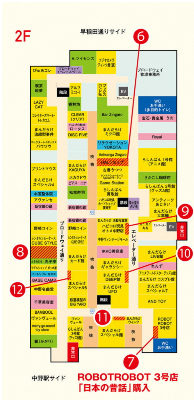
カプセルマシンの設置ポイントを、店舗ビジュアルも交えてフロア別に紹介しています。※画像は2Fのフロアマップ