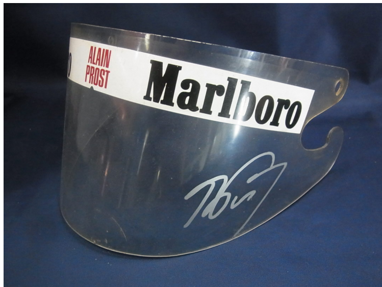
「1980 McLAREN A.プロスト」価格：27万5000円（税込）