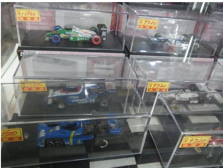
1/43スケールのF1特価品（セカンドハンド）モデル。価格：980円（税込）～