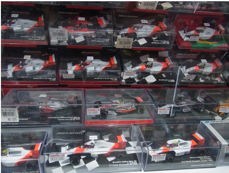
1/43スケールで再現された新品のF1ミニカーモデル。価格：4000円（税込）～