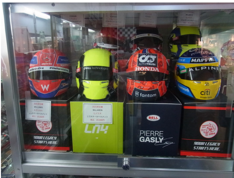
ドライバーヘルメットのミニスケールモデル。価格：2200円（税込）～