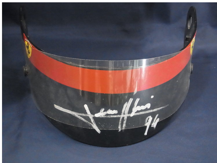
「1994 FERRARI J.アレジ」価格：8万850円（税込）