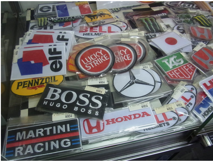
各チームのスポンサーワッペン。価格：各880円（税込）