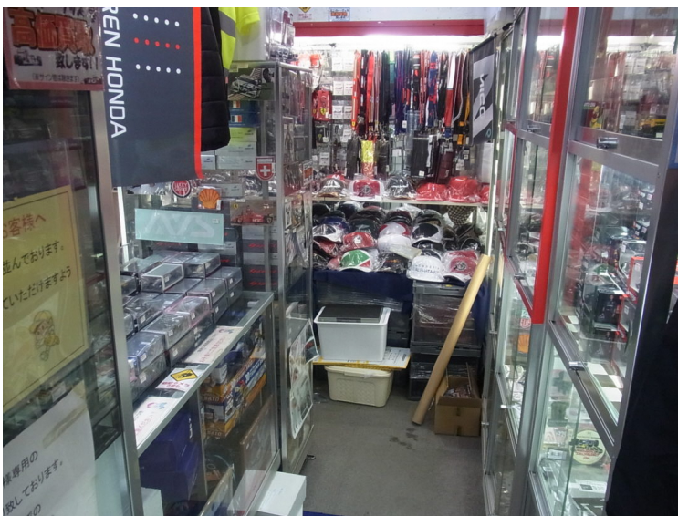
店内右側には通路があり、小さなショーケースを設置。中には1/43スケールのF1特価品（セカンドハンド）モデルやチームワッペン、ミニヘルメットなどがあり、奥には各チームのキャップやチケットホルダーなどを所狭しと陳列・販売しています。