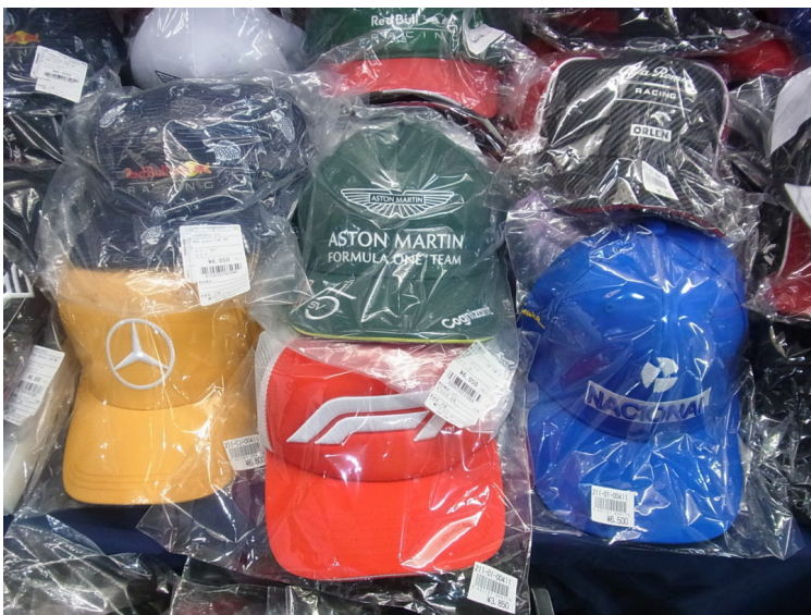
チームキャップ各種。価格：4000円（税込）～